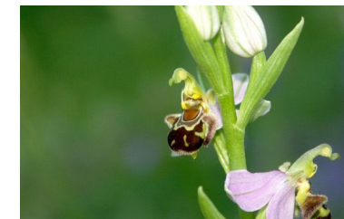
Fleur de l'orchidée Ophrys abeille

Fruit de cette co-évolution avec les insectes, les plantes ont également adopté des stratégies pour attirer les pollinisateurs et assurer leur reproduction. L'exemple de l'Ophrys abeille est incontournable : cette orchidée dupe l'abeille mâle par la ressemblance visuelle et olfactive du labelle (pétale modifié) avec une abeille femelle. Tentant de se reproduire, le mâle abusé se retrouve couvert de pollen qu'il transporte alors vers une autre « pseudo-abeille ». Parfums enivrants, morphologies particulières ou encore motifs ultraviolets sur les pétales, tous les moyens sont bons attirer le chaland et assurer sa pérennité.