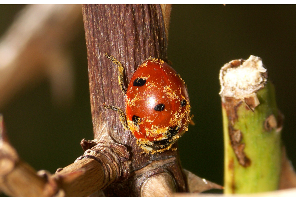
Coccinelle à 7 points recouverte de grains de pollen

Les insectes ailés ont besoin de nourriture à fort pouvoir énergétique pour compenser l'énergie dépensée par le battement de leurs ailes. Où trouver cette énergie ? Dans le nectar des fleurs, liquide essentiellement composé de sucres. C'est en cherchant ce nectar que les insectes transporteront des grains de pollen d'une fleur à l'autre, sur leurs poils, avec plus ou moins d'efficacité suivant les groupes.